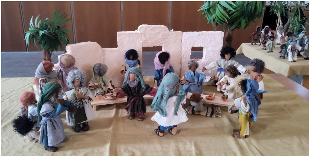
Die biblischen Erzählfiguren im Einsatz – hier bei einem Gottesdienst.

Viele von uns sind wohl schon einmal unseren biblischen Erzählfiguren begegnet, die Frauen aus der Kirchgemeinde 2009 miteinander hergestellt haben. Seit genau 15 Jahren bereichern sie unser Gemeindeleben: Mal werden die Figuren als Krippenfiguren genutzt. Die grosse Krippenszene in der Adventszeit hinten in der Kirche hat Tradition und wird oft bewundert. Auch in der Passions- und Osterzeit sind meist einige Szenen aus der biblischen Überlieferung mit den Figuren dargestellt. 2019 waren diese Szenen in den Schaufenstern einiger Dorfläden zu sehen und mit einem Osterweg zu erkunden. Manchmal kommen die Figuren im kirchlichen Unterricht zum Einsatz und helfen, dass sich die Kinder die wertvollen Geschichten aus der Bibel besser vorstellen können. Immer wieder gestaltet das Figuren-Team auch einen Gottesdienst mit, das nächste Mal am Reformationssonntag, 3. November.